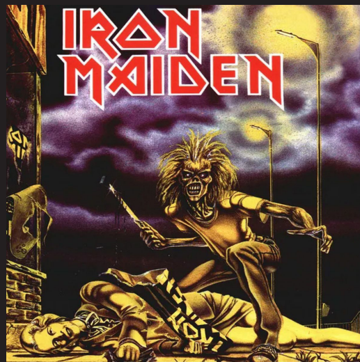
Portada de disco Sanctuary (1980)

«Eddie» se ha convertido en un icono pop, es decir un personaje que caracteriza la sociedad en una época determinada y es así porque en las portadas de disco de la banda de heavy metal, su creador, Derek Riggs (diseñador gráfico británico de Portsmouth,